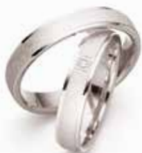
Modell: 81451, 4 mm breit