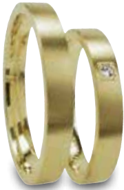
Modell: HG8809 Flacher Ring, 3,5 mm mit Brillant 0,02 Karat