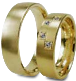
Modell: HG8813 Leicht gewölbter Ring, 6 mm breit Damenring mit 4 Brillanten à 0,02 Karat