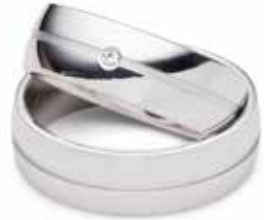
Modell: HW8803 7 mm breit