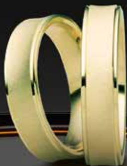
Modell: 592, 5 mm breit

Die Herstellung einfarbiger Eheringe ist ein handwerklicher Prozess, der auf Präzision, Sorgfalt und einer tiefen Verbindung zu den Wünschen des zukünftigen Ehepaars basiert. Diese Ringe symbolisieren nicht nur die Liebe und den Bund zweier Menschen, sondern sollen auch ästhetisch ansprechend und zeitlos sein.