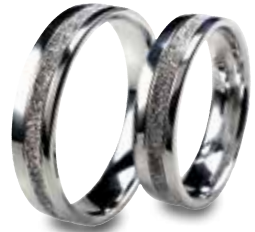
Modell: 8556 Weißgoldring, 5 mm breit