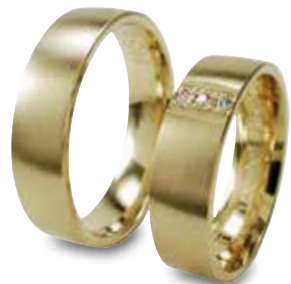
Modell: HG8810 leicht gewölbt, 6 mm breit Damenring mit 3 Brillanten à 0,01 Karat