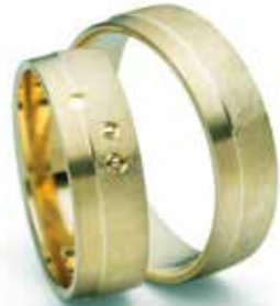
Modell: 88632 6 mm breit