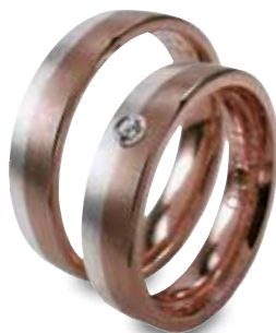
Modell: H1556 5 mm breit mit einem Brillanten 0,04 Karat