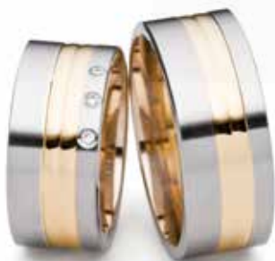
Modell: 82964 9 mm breit