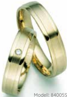
Modell: 84005SM 5 mm breit