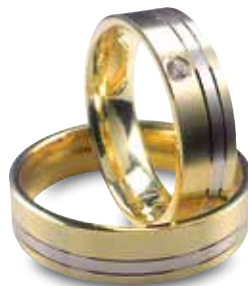
Modell: 82663 6 mm breiter Ring, flach, Gelb-/Weiß-/Gelbgold, ein Brillant in 0,04 Karat