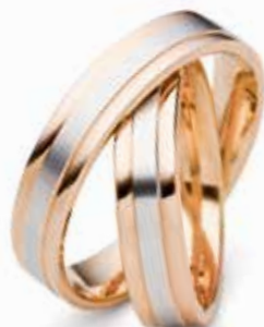
Modell: 82509SM Rot Weiß 5 mm breit