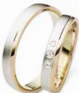
Modell: 81344 3,5 mm breit