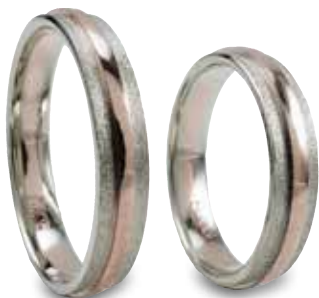
Modell: 81449 4 mm breit in Weiß-/Rot-/Weißgold