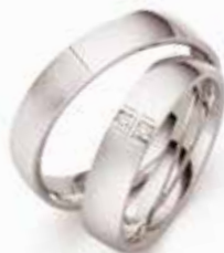
Modell: E77502, 4,5 mm breit