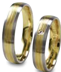
Modell: HWG8819 gewölbter 5 mm Ring mit einem Brillanten 0,02 Karat