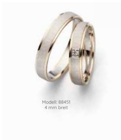
Modell: 88451 4 mm breit