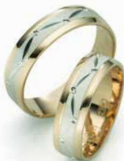
Modell: 650RWR 6 mm breit