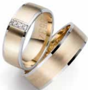
Modell: 88634 6,5 mm breit