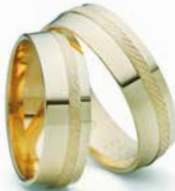
Modell: 88633 6 mm breit