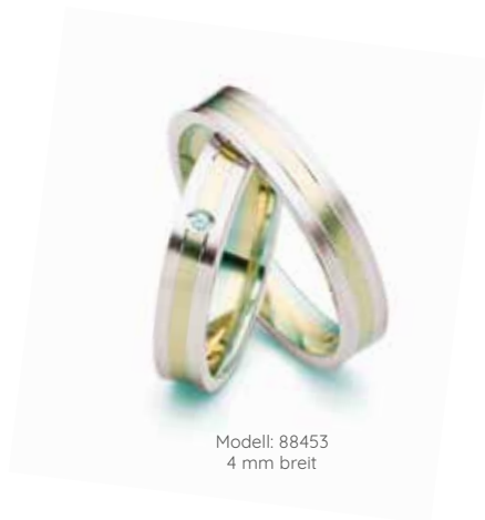
Modell: 88453 4 mm breit