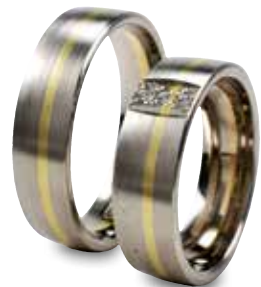
Modell: HWG 8810 flach gewölbter Ring, 6 mm breit, mit 3 Brillanten 0,01 Karat