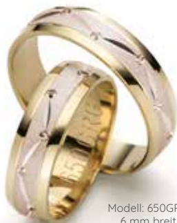
Modell: 650GRG 6 mm breit