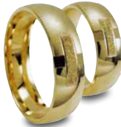
Modell: 84664 Gelbgold und 6 mm breit