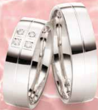
Modell: E77604 6 mm breit