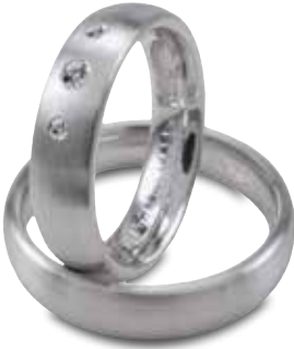
Modell: HW8824 gewölbter Ring, 5,5 mm breit, Weißgold, mit Brillanten 1 x 0,04 und 2 x 0,01 Karat