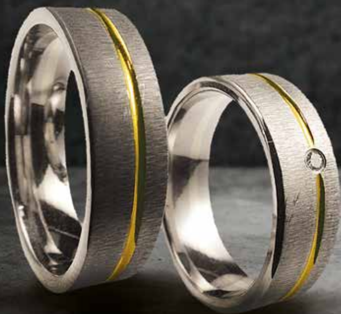
Modell: 87660 flacher 6 mm breiter Ring, querstrich matt, mit 1 x 0,02 Karat