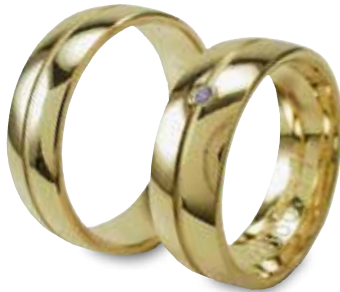
Modell: HG8803 Gewölbter Ring, 7 mm breit mit matter Rille + Brillanten 0,02 Karat