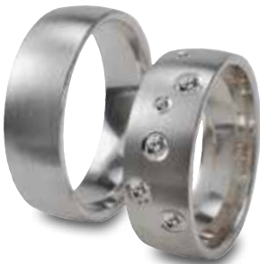
Modell: HW8825 Weißgoldring mit Brillanten, 7 mm breit, 4 x 0,04 + 2 x 0,01 Karat