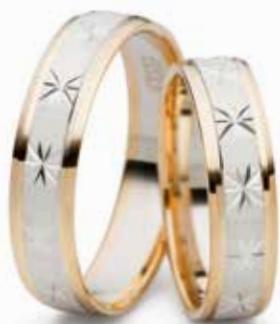
Modell: 516GWG 5 mm breit