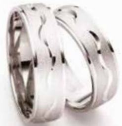
Modell: 85626FM 6 mm breit