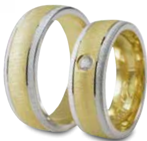
Modell: 87720 7 mm breit