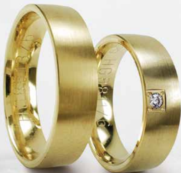
Modell: HG8811, leicht gewölbt, 6 mm breit, Damenring mit einem Brillanten 0,04 Karat