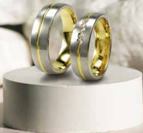
Modell: HWG8801 gewölbter Ring 6,5 mm breit, mit 5 Brillanten á 0,01 Karat

Die Fertigung zweifarbiger Trauringe ist ein kunstvoller Prozess, der Handwerkskunst und kreative Gestaltung miteinander verbindet. Diese Ringe, oft auch als Bicolor-Ringe bekannt, symbolisieren die Einheit zweier Menschen durch die Kombination von zwei unterschiedlichen Metallen. Typischerweise werden hierfür Kombinationen wie Gelbgold und Weißgold oder Roségold und Weißgold gewählt, um einen harmonischen Kontrast zu schaffen.