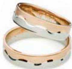
Modell: 88526 5 mm breit