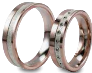
Modell: 81550 5 mm, Rot-/Weiß-/Rotgold mit Punkten