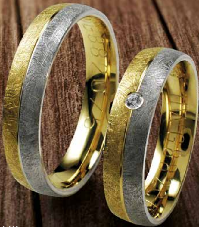
Modell: HWG8820 Eismatter Ring, 5 mm breit, Gelb- und Weißgold mit einem Brillanten 0,02 Karat