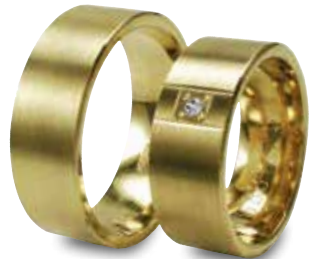
Modell: HG8812 8 mm breit mit einem Brillant 0,04 Karat