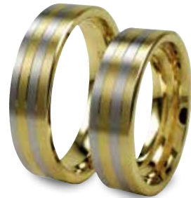
Modell: H2624 flacher Ring, 6 mm breit in Weiß-/Gelb-/Weiß-/Gelbgold