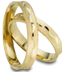
Modell: 3456 4 mm breit