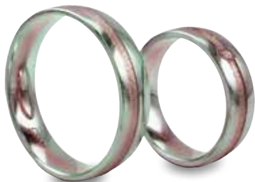
Modell: 81551 5,5 mm breiter Ring mit einem Brillanten 0,04 Karat in Weiß-/Rot-/Weißgold