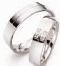
Modell: E77504, 5 mm breit