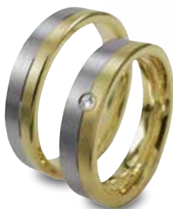
Modell: H1543 flacher Ring, 5 mm breit, Gelb- und Weißgold, mit Brillant 1 x 0,02 Karat