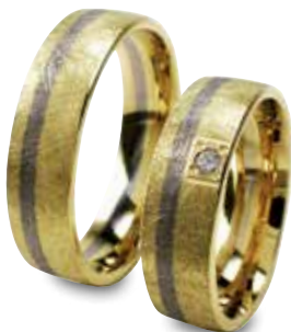
Modell: HWG 8811 flach gewölbt und 6 mm breit, ein Brillant mit 0,04 Karat