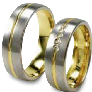
Modell: HWG8801 gewölbter Ring 6,5 mm breit mit 5 Brillanten á 0,01 Karat