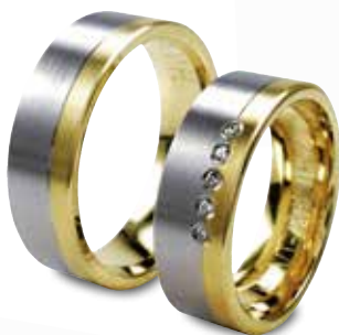
Modell: HWG8805 7 mm breit