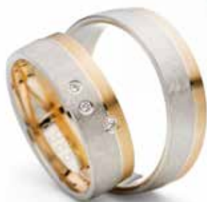
Modell: 88631 6 mm breit