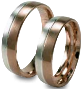
Modell: HWR8808 5,5 mm in Weiß- und Rotgold