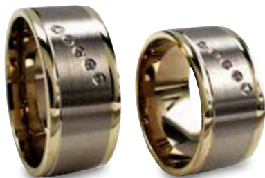
Modell: 86609 10 mm breit, mit fünf Brillanten à 0,01 Karat