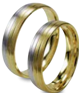
Modell: HWG8804 5 mm breiter Ring in Weiß- und Gelbgold