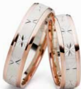
Modell: 516RWR 5 mm breit