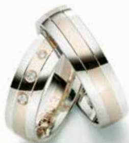
Modell: E77603 6 mm breit