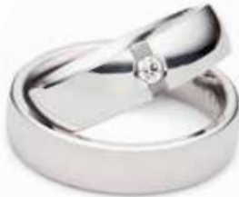
Modell: 86604 6 mm breit