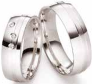
Modell: E77601 6 mm breit