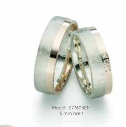
Modell: E77605EM 6 mm breit